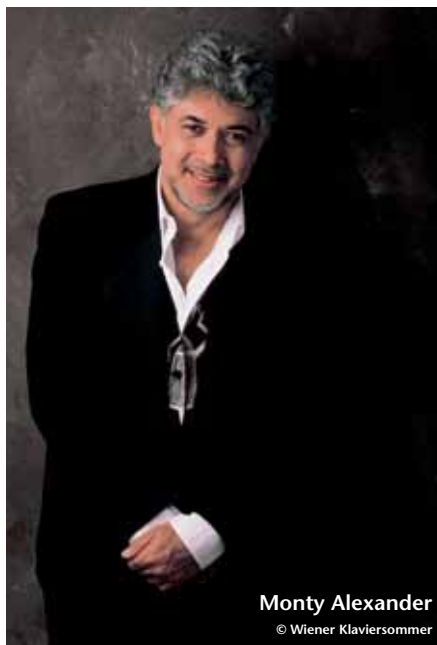
Monty Alexander

ist und bleibt der Grundgedanke dieses Festivals, den „Sommerwienern“ Klavierkonzerte vom Feinsten zu bieten. So sagte doch schon Mozart, als er 1781 nach Wien kam, um in der österrei-